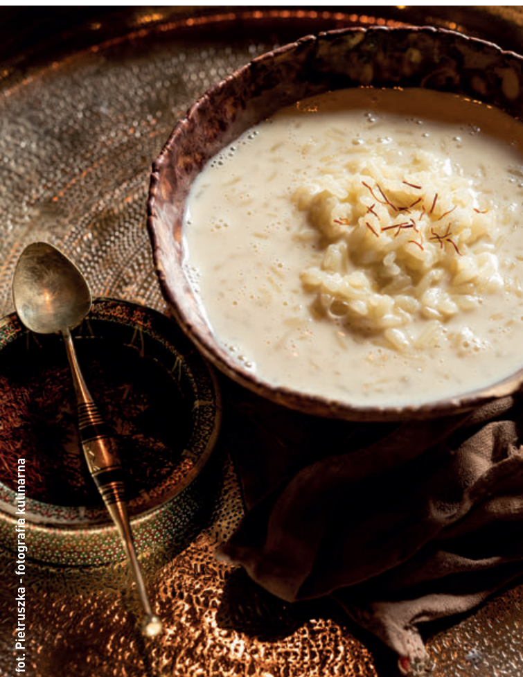
fol. Pietruszka - fotografia kulinarna